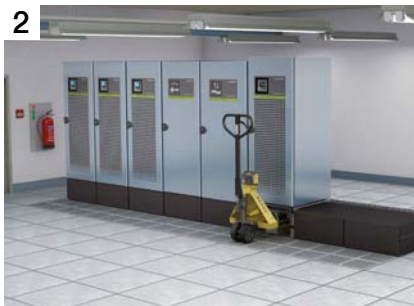
600 kW, mode on-line double conversion