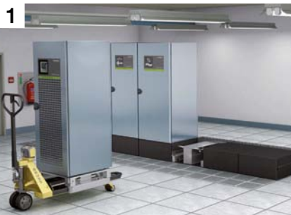
600 kW, mode on-line double conversion