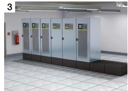
Après 30 minutes : 800 kW, mode on-line double conversion