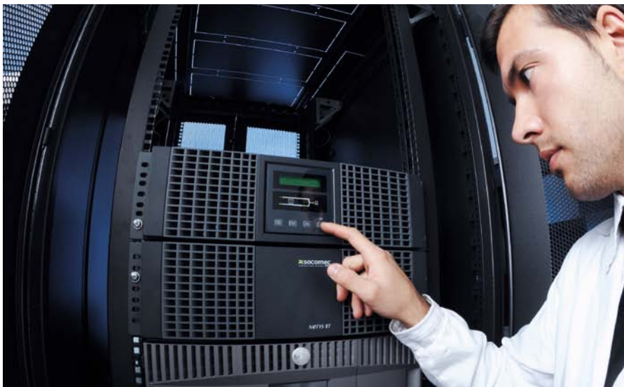
APU 375 A