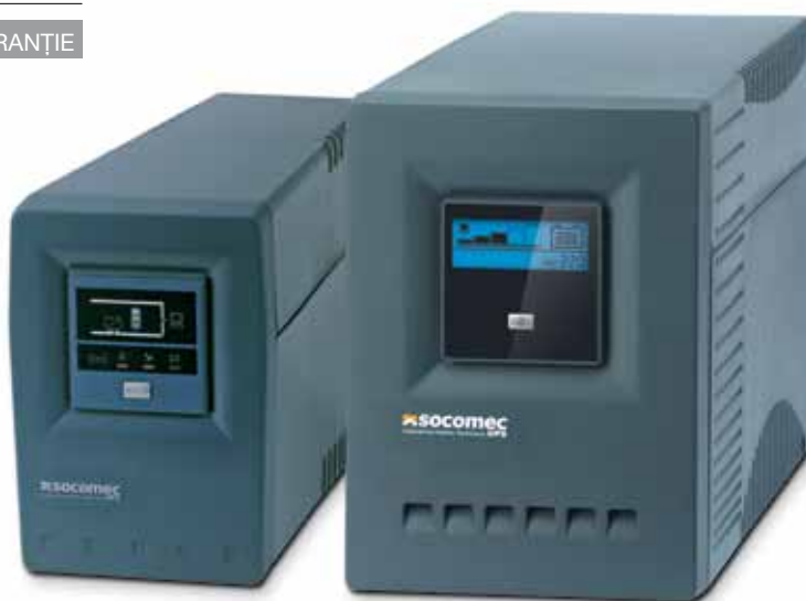
NETYS PE 1000/1400/2000 VA